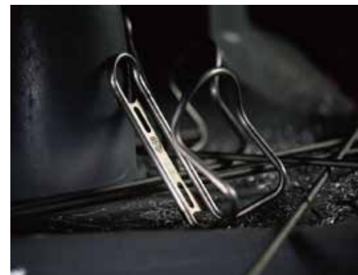
SICURO Bottle Cage Ti