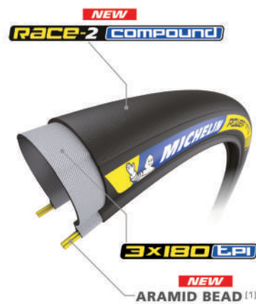
(1) EASY TO FIT

販売価格 7,000 円(本体価格) サイズと平均重量 700×23C/180g 700×25C/190g ケーシング密度 3×180tpi 指定空気圧 5-8bar カラー ブラック 折り畳み可 THE RACE