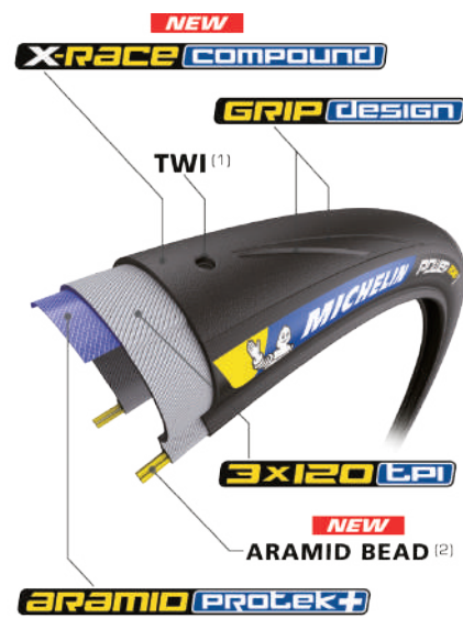
(1) TREAD WEAR INDICATOR (2) EASY TO FIT

販売価格 5,200 円(本体価格) サイズと平均重量 700×23C/223g 700×25C/235g 700×28C/255g ケーシング密度 3×120tpi 指定空気圧 5-8bar カラー ブラック ブルー レッド ※ブルーとレッドは25Cのみ 折り畳み可 COMPETITION LINE