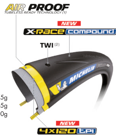
(1) EFFICIENT ONLY WITH SEALANT (2) TREAD WEAR INDICATOR

販売価格 7,600 円(本体価格) サイズと平均重量 700×25C/275g 700×28C/305g 700×32C/350g ケーシング密度 4×120tpi 指定空気圧 5-8bar カラー ブラック 折り畳み可 COMPETITION LINE